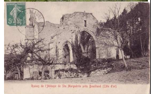
Ruines de l'Abbaye de Site Marguerite près Bouilland (Côte d'or)